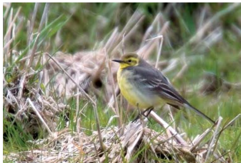
Nere vid udden fanns en fin citronärsla.

ten började återvända. Åtminstone hos dem som fick nytt kryss.